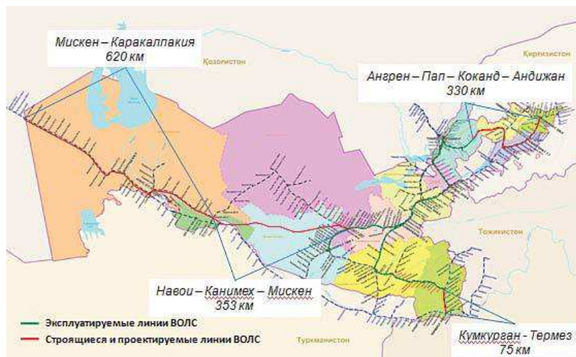
Рис. 2. Дальнейшие перспективы развития ВОЛС

Новая версия веб-сайта по адресу http://railway.uz была запущена 31.07.2015 г.