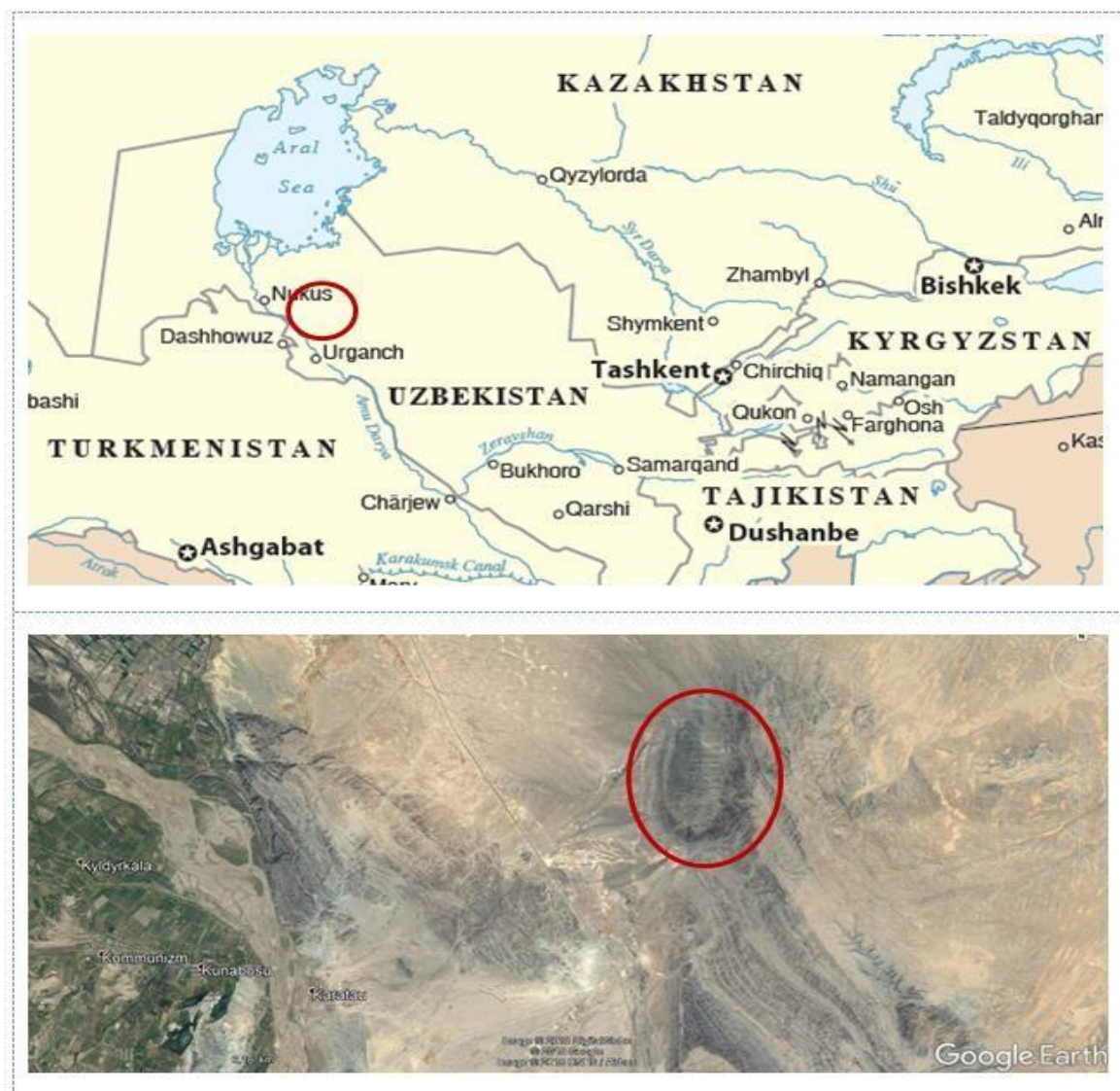
Рисунок 1: Расположение месторождения Тебинбулак (красный круг).

Месторождение железной руды Тебинбулак расположено примерно в 740 км к западу от г.Ташкент. Регион является частью Центрально-азиатской степной области с холмистой местностью без деревьев и кустарников. Он расположен у северо-западной оконечности гор Султан-Увайс в Караузякском районе (рисунок 1).