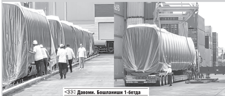
Давоми. Бошланиши 1-бетда

Ушбу муҳим жараёнда “Темирйўлкарго” акциядорлик жамияти халқаро мультимодал логистика оператори сифатида етакчи ролни бажарди. Ташувлар ишлаб чиқарувчи заводдан Ўзбекистондаги якуний манзилгача “эшикдан-эшиккача” тамойили асосида амалга оширилди.