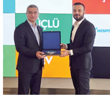
га мос хизмат кўрсатиш тизими кўриб чиқилди. Расмий учрашувлар даво-

мида икки томонлама ҳамкорлик, мутахассислар малакасини ошириш, тажриба алмашиш, телемедицина ва қўшма лойиҳаларни йўлга қўйиш масалалари муҳокама қилиниб, келгусида ҳамкорлиқни кенгайтириш бўйича меморандумлар имзоланди. Ўрганилган илғор тажрибалар "Темир йўл ижтимоий хизматлар" масъулияти чекланган жамияти тизимида тиббий-ижтимоий хизматлар сифатини оширишга хизмат қилади.